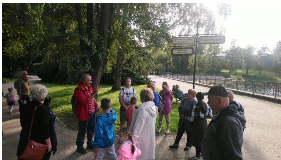
Fotografia 21. Wycieczka do Pokrzywnej 2019 rok

We wrześniu 2019r. została zorganizowana trzecia impreza integracyjna dla rodzin zastępczych. Tym razem był to dwudniowy wyjazd aktywizacyjno-integracyjny do Kudowy-Zdrój dla spokrewnionych rodzin zastępczych i dzieci w nich umieszczonych ( rok wcześniej czyli w 2018r. w dwudniowej wycieczce uczestniczyły rodziny zawodowe i niezawodowe). Uczestnikom wycieczki zapewniono transport, nocleg w Ośrodku wypoczynkowym „ Góry Stołowe”. Uczestnicy wycieczki mieli również zapewnionego przewodnika, który przez dwa dni pilotował wycieczkę. Rodziny zwiedziły m.in. Twierdzę w Kłodzku, Kaplicę Czaszek, Park zdrojowy w Polanicy.