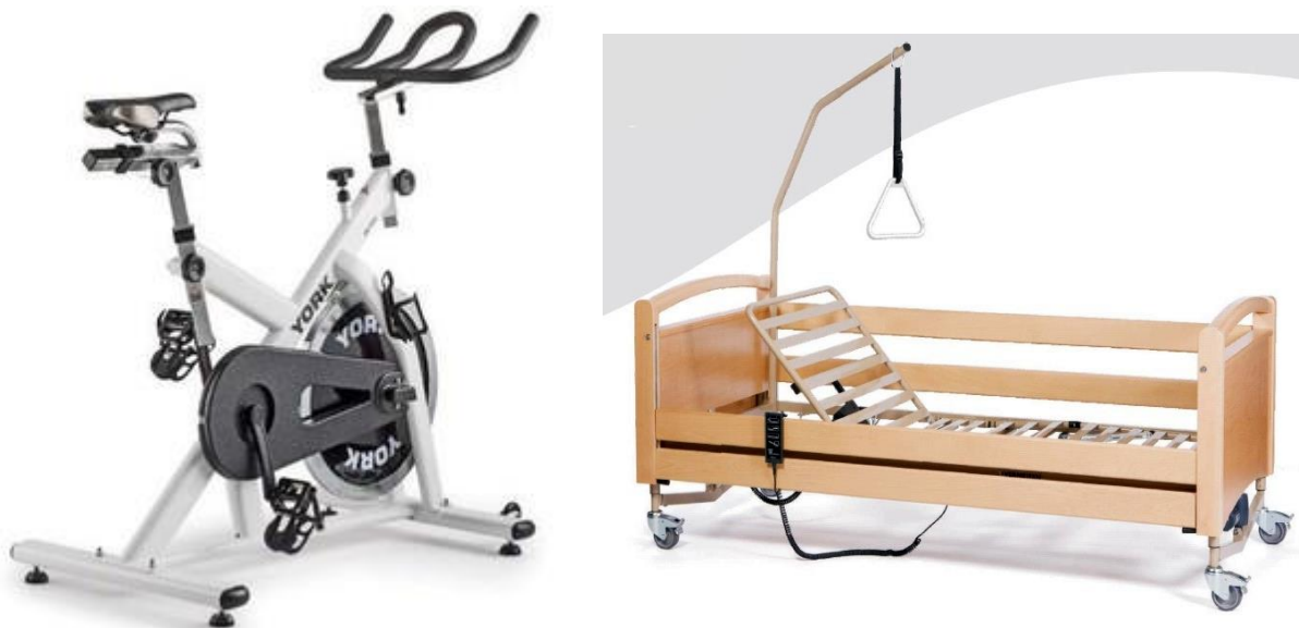
Fotografia 1 i 2. Rower rehabilitacyjny i łóżko rehabilitacyjne