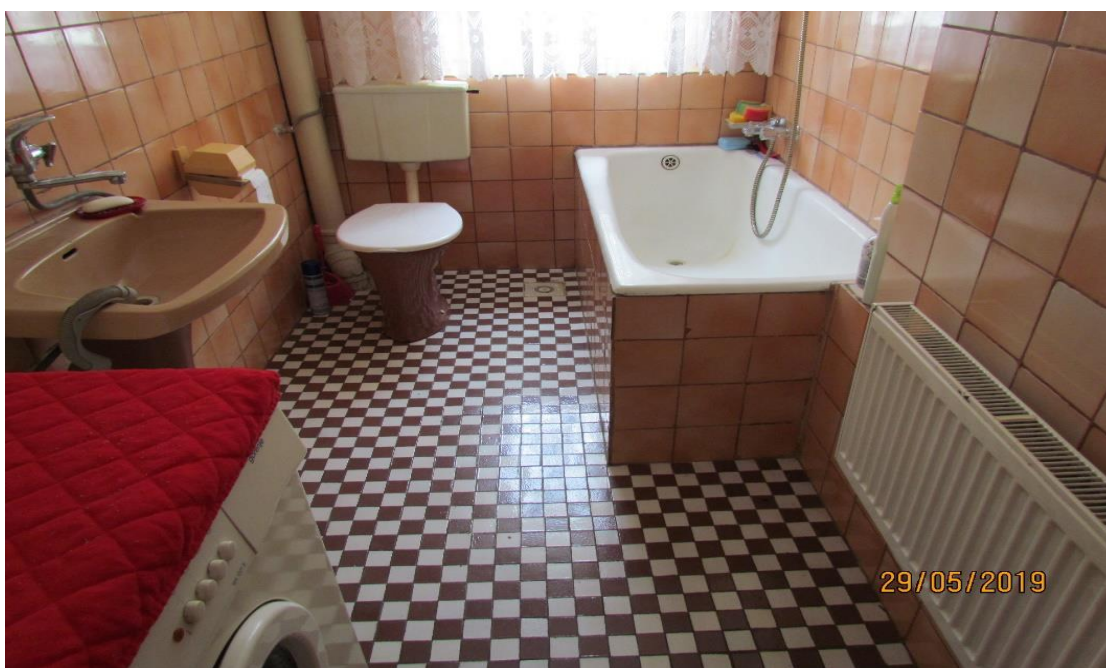
Fotografia nr. 8 Łazienka dostosowana do osoby niepełnosprawnej z dysfunkcją narządu wzroku w roku 2019