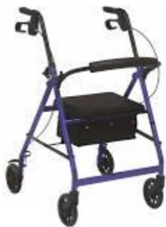
Fotografia 3 i 4. Balkonik i wózek inwalidzki