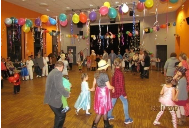
Fotografia 18. Bal karnawałowy