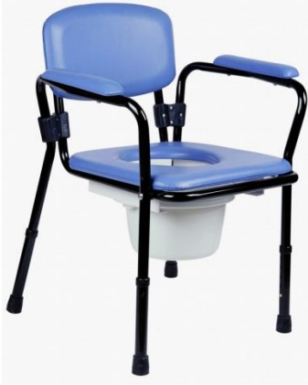
Fotografia 8. Krzesło toaletowe