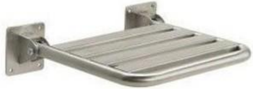
Fotografia 9. Siodełko prysznicowe uchylne