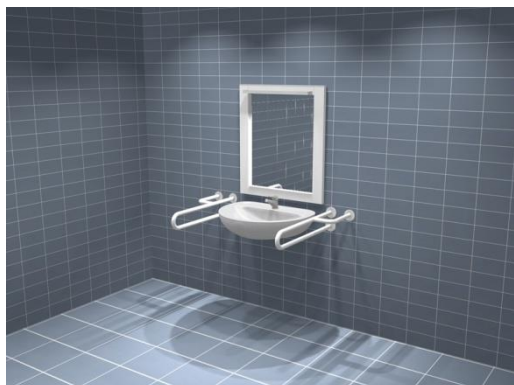
Fotografia 14. Uchwyty łazienkowe