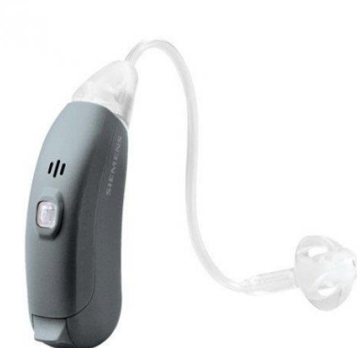
Fotografia 4. Aparat słuchowy