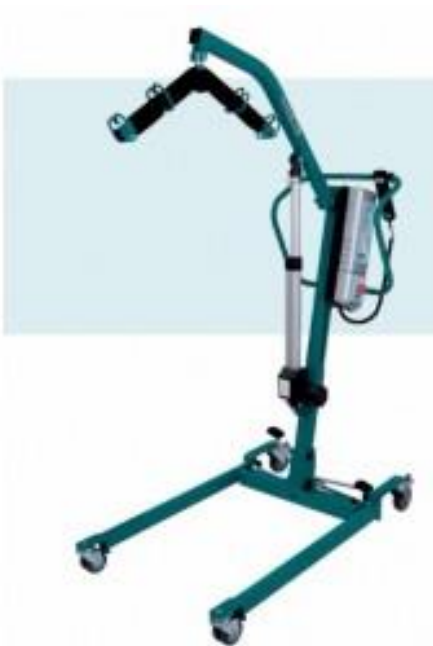
Fotografia 10. Podnośnik wannowy