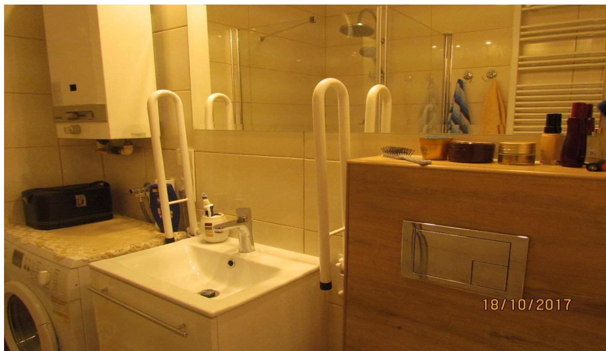
Fotografia 7. Łazienka po dostosowaniu dla osoby niepełnosprawnej c.d.