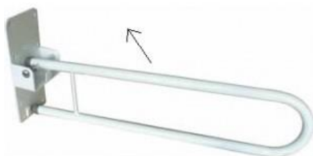
Fotografia 16. Uchwyty łazienkowe c.d.