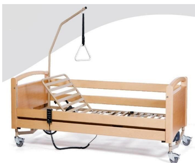
Fotografia 1. Łóżko rehabilitacyjne