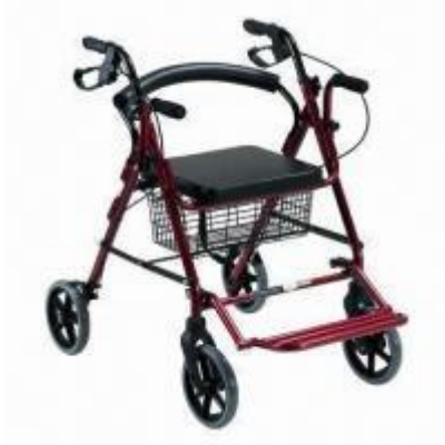
Fotografia 2. Balkonik