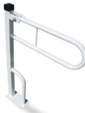
Fotografia 15. Uchwyty łazienkowe c.d.