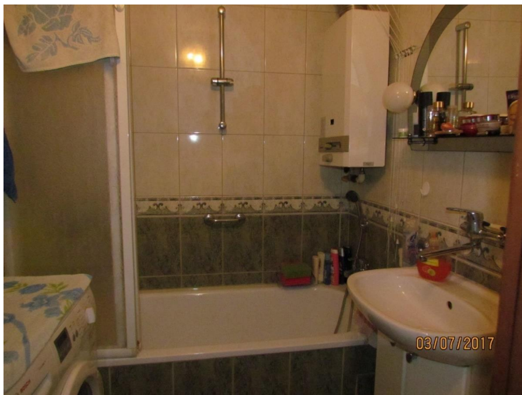
Fotografia 5. Łazienka przed dostosowaniem do potrzeb osoby niepełnosprawnej